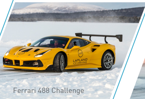
Ferrari 488 Challenge