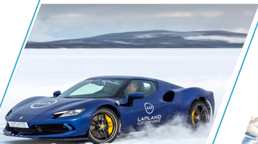
Ferrari 296 GTB